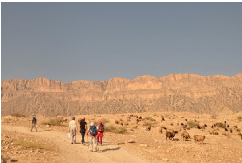
L'Iran authentique: sédentaires d'hier et nomades d'aujourd'hui